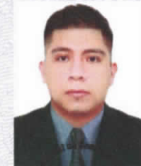
SECRETARIA GENERAL UNSA

Dado y firmado en Arequipa, el 18 de noviembre de 2025