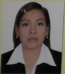
Registrado en el libro N° 2 A fojas 842 bajo el N° 1