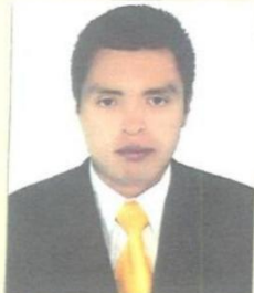
Registro Libro 29-A Folio 3448