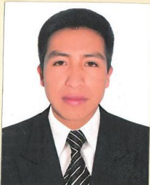
Registro Libro 27-A Folio 3092

Dado y firmado en Ñaña, Lima con fecha seis de enero del 2016