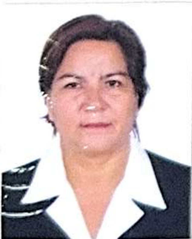
Registro Libro 29-A Folio 3530

Dado y firmado en Ñaña, Lima con fecha doce de enero del 2016