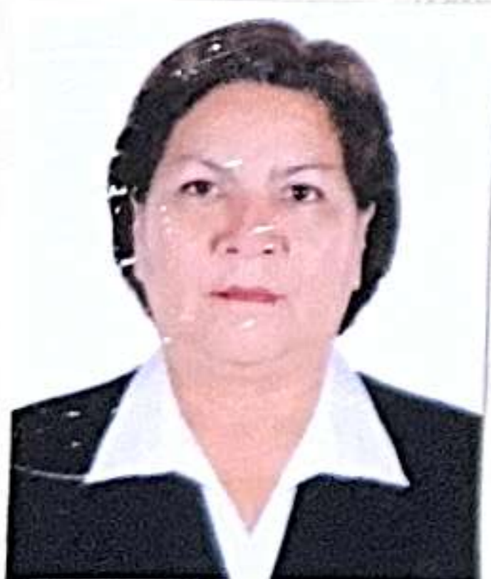
Registro Libro 20-B Folio 2740

Dado y firmado en Ñaña, Lima con fecha cinco de octubre del 2016