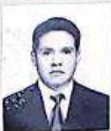
REGISTRO Libro XLI Folio 10231

Dado y firmado en Trujillo, el día Diez del mes de Mayo del 2005