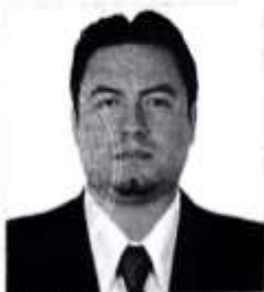
Registro Libro 32-A Folio 4354

Dado y firmado en Ñaña, Lima con fecha veintidós de enero del 2018