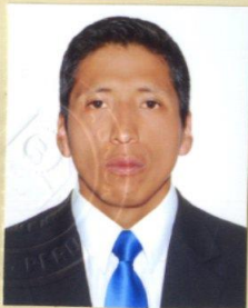
Registro Libro 33-A Folio 4566

Dado y firmado en Ñaña, Lima con fecha veinticuatro de enero del 2018