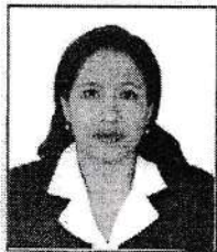
Registrado en el libro N° 3 A fojas 974, bajo el N° 16