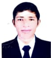
Registro Libro 21-B Folio 2936

Dado y firmado en Ñaña, Lima con fecha veintiocho de febrero del 2017