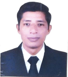
Registro Libro 28-A Folio 3237

Dado y firmado en Ñaña, Lima con fecha seis de enero del 2016