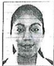
Registrada en el libro N° 2 Al folio 872, tomo el N° 39