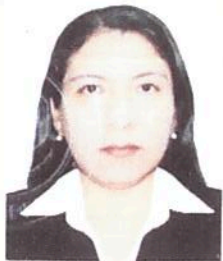
Registro Libro N° 18-B Folio 2402

Dado y firmado en Ñaña, Lima a los Veintiséis días de Agosto del 2015