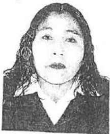
Registro Libro 20-B Folio 2879

Dado y firmado en Ñaña, Lima con fecha dieciséis de noviembre del 2016