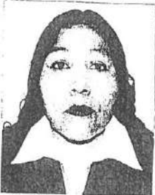
Registro Libro 29-A Folio 3308

Dado y firmado en Ñaña, Lima con fecha ocho de enero del 2016