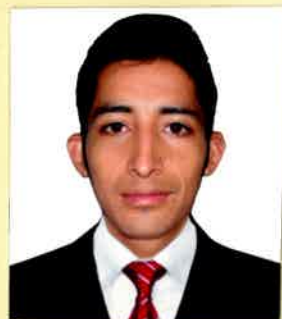
Registro Libro 30-A Folio 4018

Dado y firmado en Ñaña, Lima con fecha once de enero del 2017