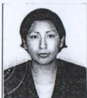
Registro: Libro Nº. 5-8. Folio Nº. 1132

Dado y firmado en Ñaña , Lima, a los Dos días de Junio del 2000.