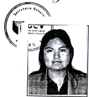
Registrado en el libro N° 3 A fojas 728 bajo el N° 14