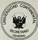
[Signature] Ma. Jorge A. Villavicencio Samanez Secretario General

Dado y firmado en la ciudad de Huancayo el día 15 de marzo de 2021.