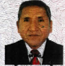
SECRETARIA GENERAL UNSA