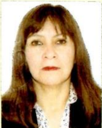
Registro Libro 34-A Folio 4776

Dado y firmado en Ñaña, Lima con fecha veinticuatro de enero del 2018