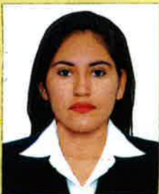
Registro Libro 32-A Folio 4314

Dado y firmado en Ñaña, Lima con fecha veintidós de enero del 2018