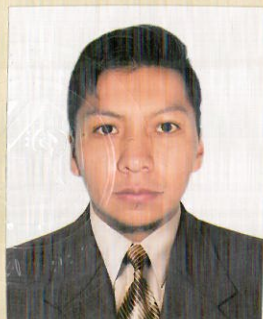
Registro Libro 29-A Folio 3325

Dado y firmado en Ñaña, Lima con fecha ocho de enero del 2016