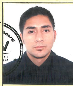
Registrado en el libro respectivo A fojas 301 bajo el N° 10