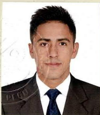
Registro Libro 32-A Folio 4340

Dado y firmado en Ñaña, Lima con fecha veintidós de enero del 2018