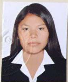
Registro Libro 33-A Folio 4546

Dado y firmado en Ñaña, Lima con fecha veinticuatro de enero del 2018